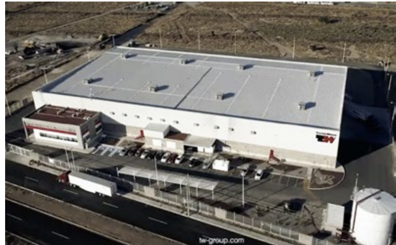
NAVE TRUCK & WHEEL