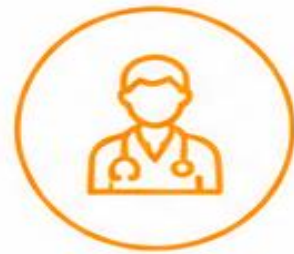
Doctores o médicos especialistas