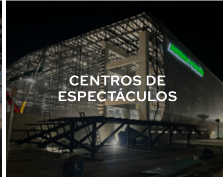
CENTROS DE ESPECTÁCULOS