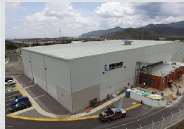
NAVE WHIRLPOOL CELAYA, GUANAJUATO 65,7000 m 2