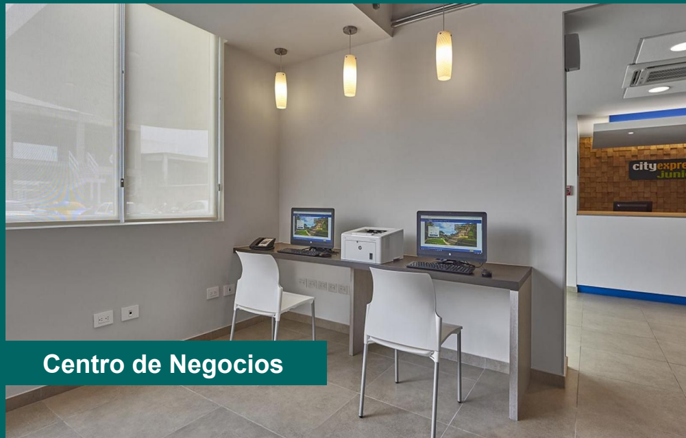
Centro de Negocios