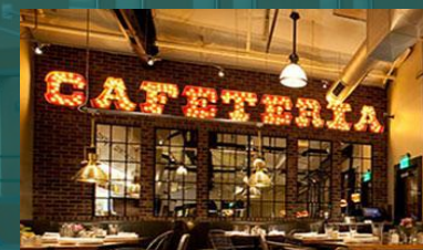
CAFETERIAS Y Wings