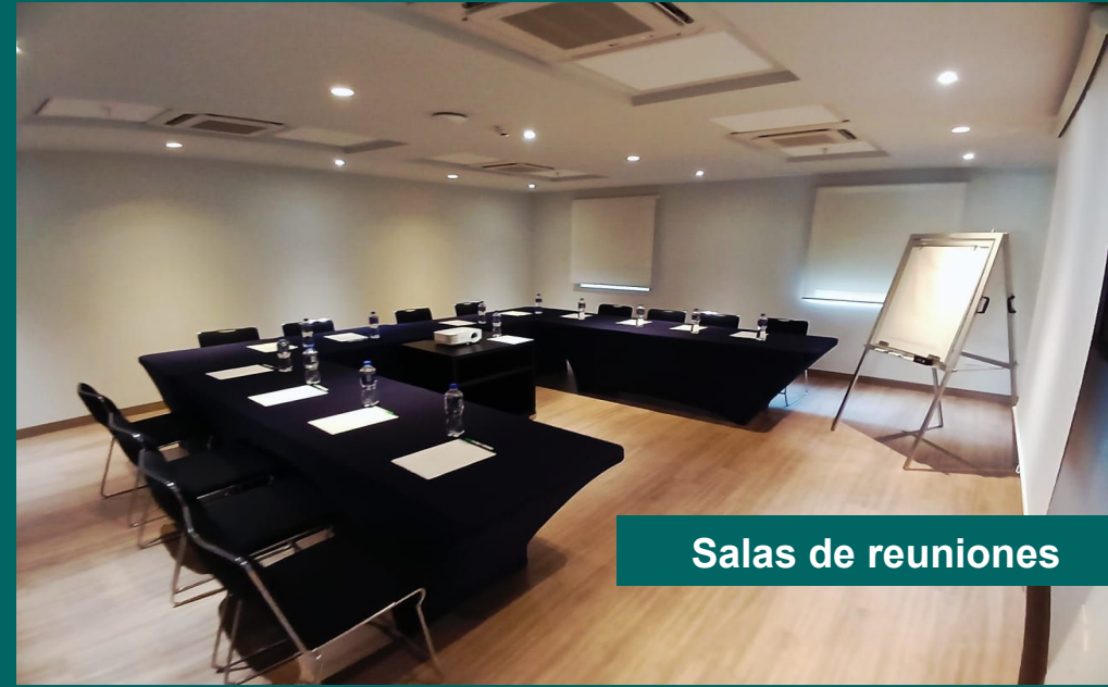
Salas de reuniones